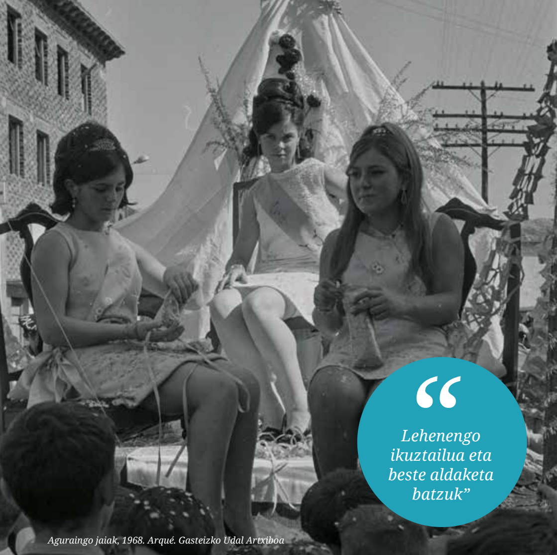
Aguraingo jaiak, 1968. Arqué. Gasteizko Udal Artxiboa