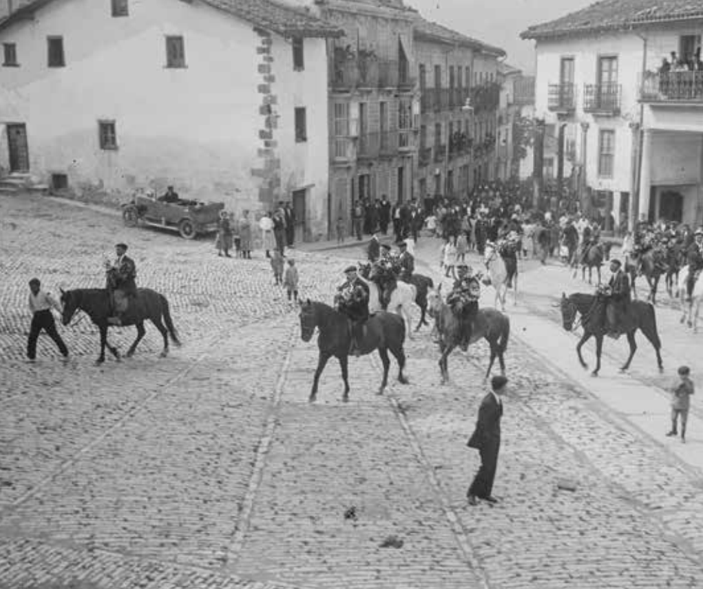
▲ Agurain, 1930 irian. E.Guinea Gasteizko Udal Artxiboa