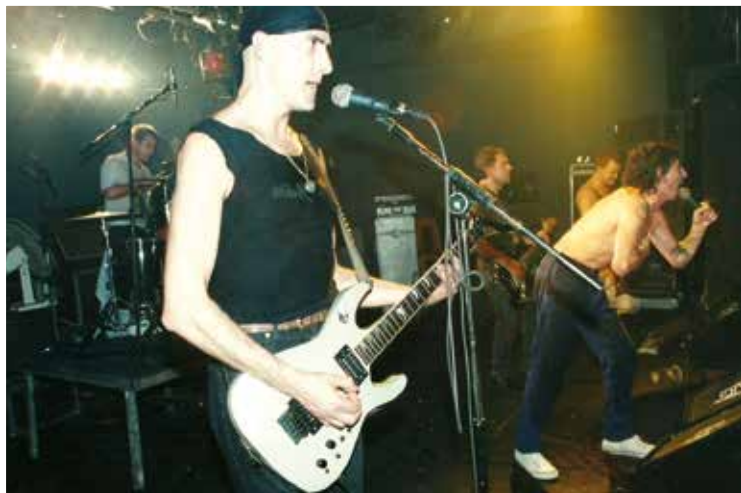
▲ La Polla Records bere herrian kontzertuan.