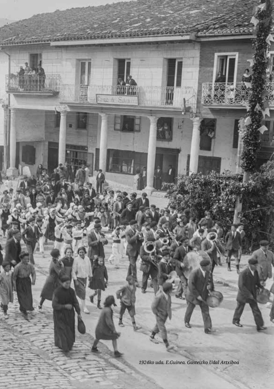
1924ko uda. E.Guinea. Gasteizko Udal Artxiboa