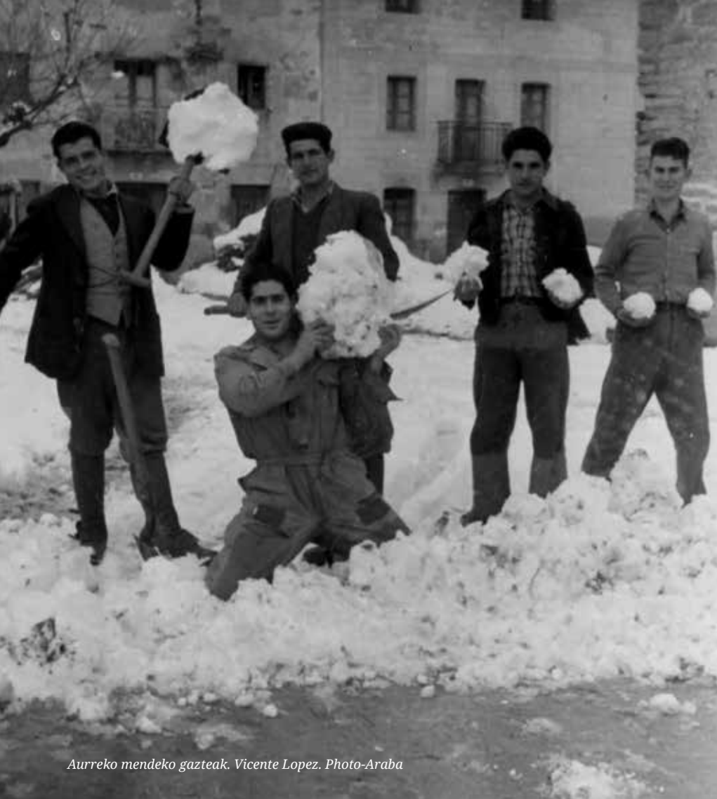
Aurreko mendeko gazteak. Vicente Lopez. Photo-Araba