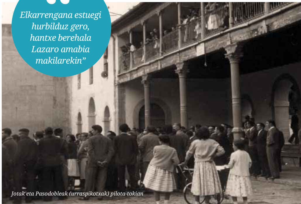
Jotak eta Pasodobleak (urraspikotxak) pilota-tokian

Elkarrengana estuegi hurbilduz gero, hantxe berehala Lazaro amabia makilarekin”