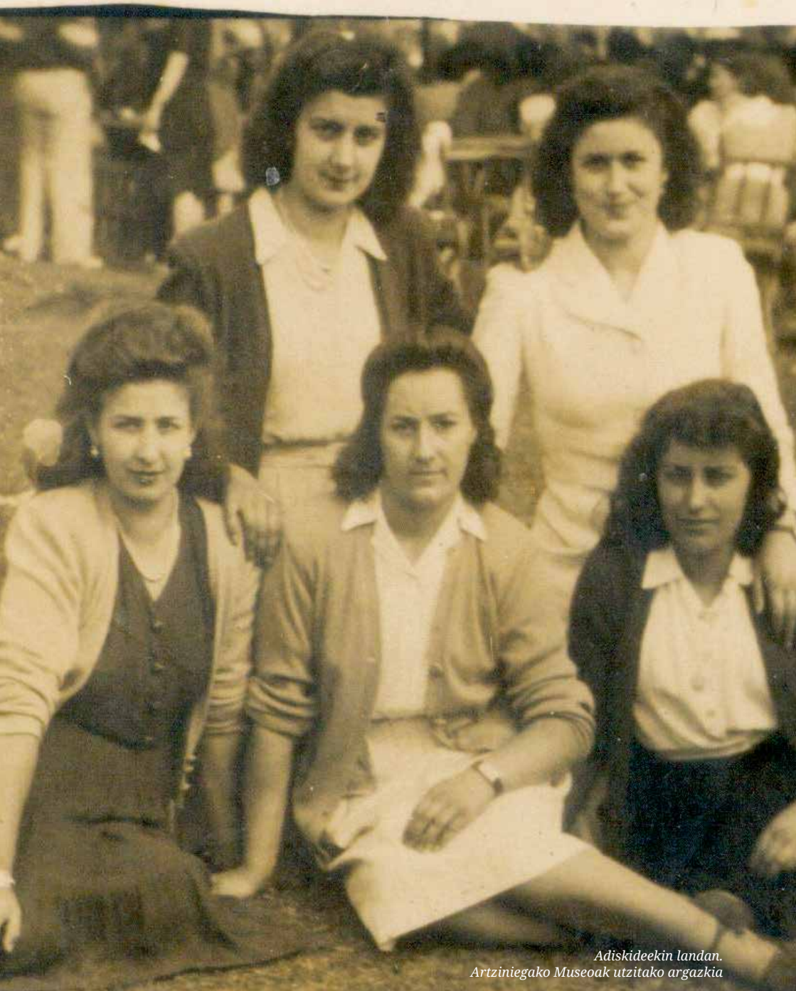
Adiskideekin landan.